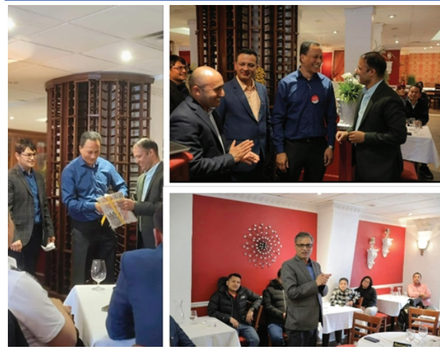
गैरआवासीय नेपाली संघ क्यानडाको विधान समितिले तयार पारेको संस्थाको विधान मस्यौदा हस्तान्तरण गर्दै ।