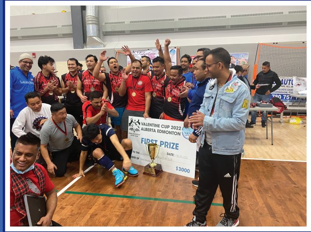
भलिवलको उपाधी लालीगुराँसलाई ।